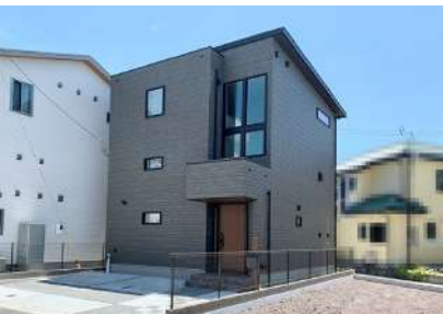
迫力のある4連窓がスタイリッシュな外観