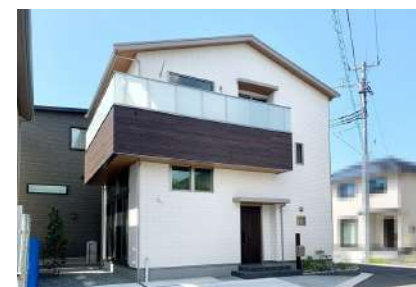
家を約半周するほどのビッグバルコニー