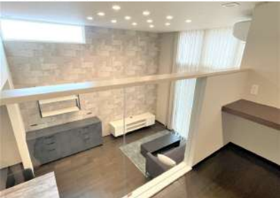
程よい距離感で空間がつながる1.5階