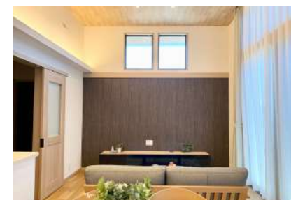
天井までのハイリッツで明るいリビング