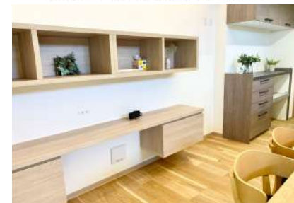
ご家族みんなが使えるワークスペース