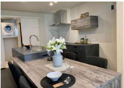
高級感のあるキッチンハウスの「デュエ」